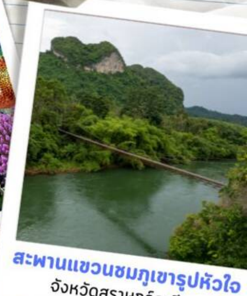
สะพานแขวนชมภูเขารูปหัวใจ จังหวัดสุราษฎร์ธานี