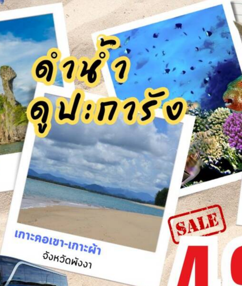
เกาะคอกเขา-เกาะผ้า จังหวัดพังงา