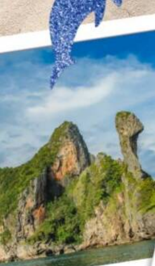
หมู่เกาะปอดะ จ.กระบี่